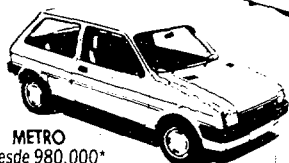
METRO Desde 980.000*