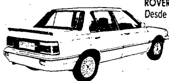
ROVER 216 Desde 1.638.000*